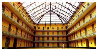
FAMILISTERE GUISE et SOMMERON