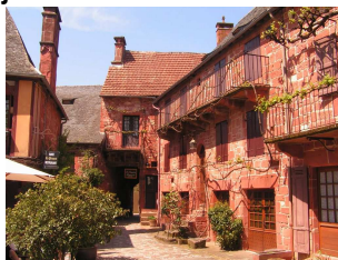
PERIGORD et QUERCY

Vous trouverez en annexes toutes les informations et bulletins d'inscriptions à nous retourner pour le 15 février 2023