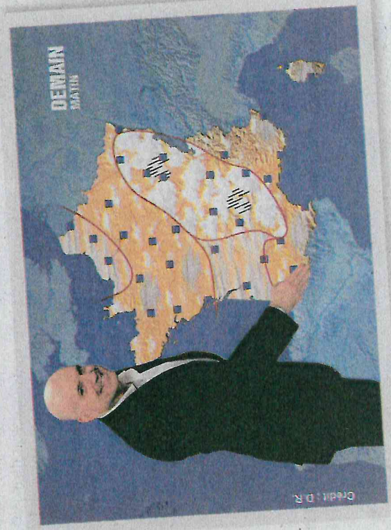
Né à Reims, Louis Bodin est le chef du service météo et prévisionniste-présentateur de la météo à RTL depuis 2002.

Initiativ Retraite 51-08 et la Section des anciens exploitants de la Marne seront présents toute la journée du mardi 6 septembre sur le parvis de la Foire, à côté de la grande bouteille Nicolas-Feuillatte pour renseigner les retraités et futurs retraités du monde agricole.