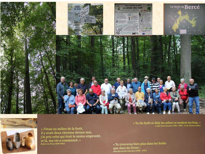
Octobre, à la découverte de la forêt de BERCE