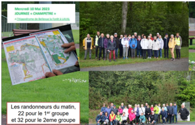
Mai, journée champêtre