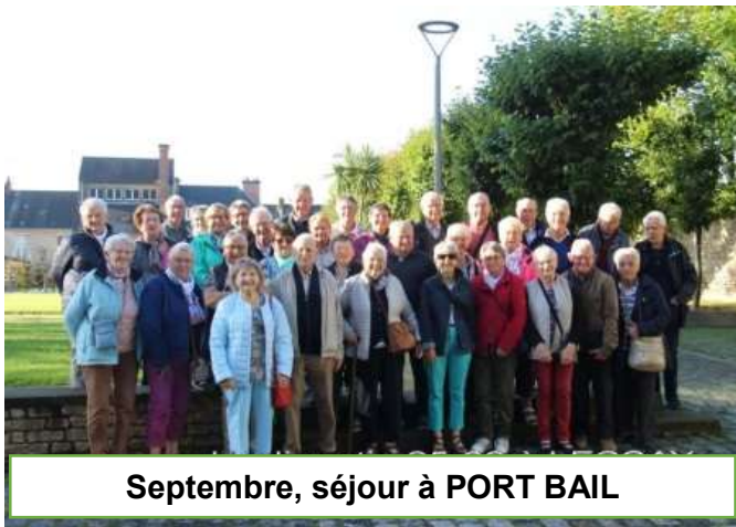
Septembre, séjour à PORT BAIL