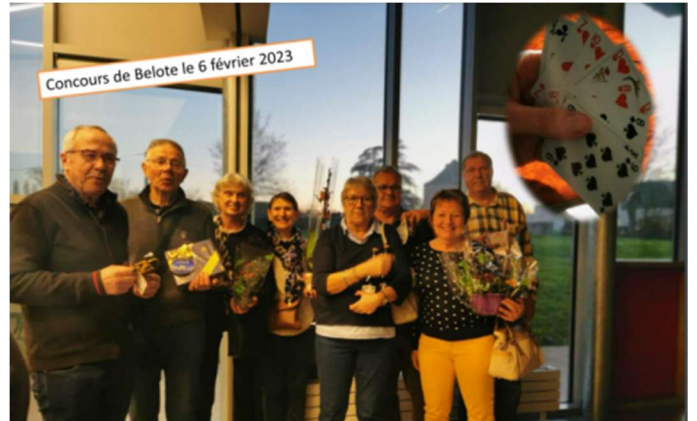
Février, concours de belote