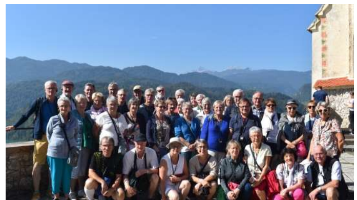
Septembre, séjour en SLOVESTRIE